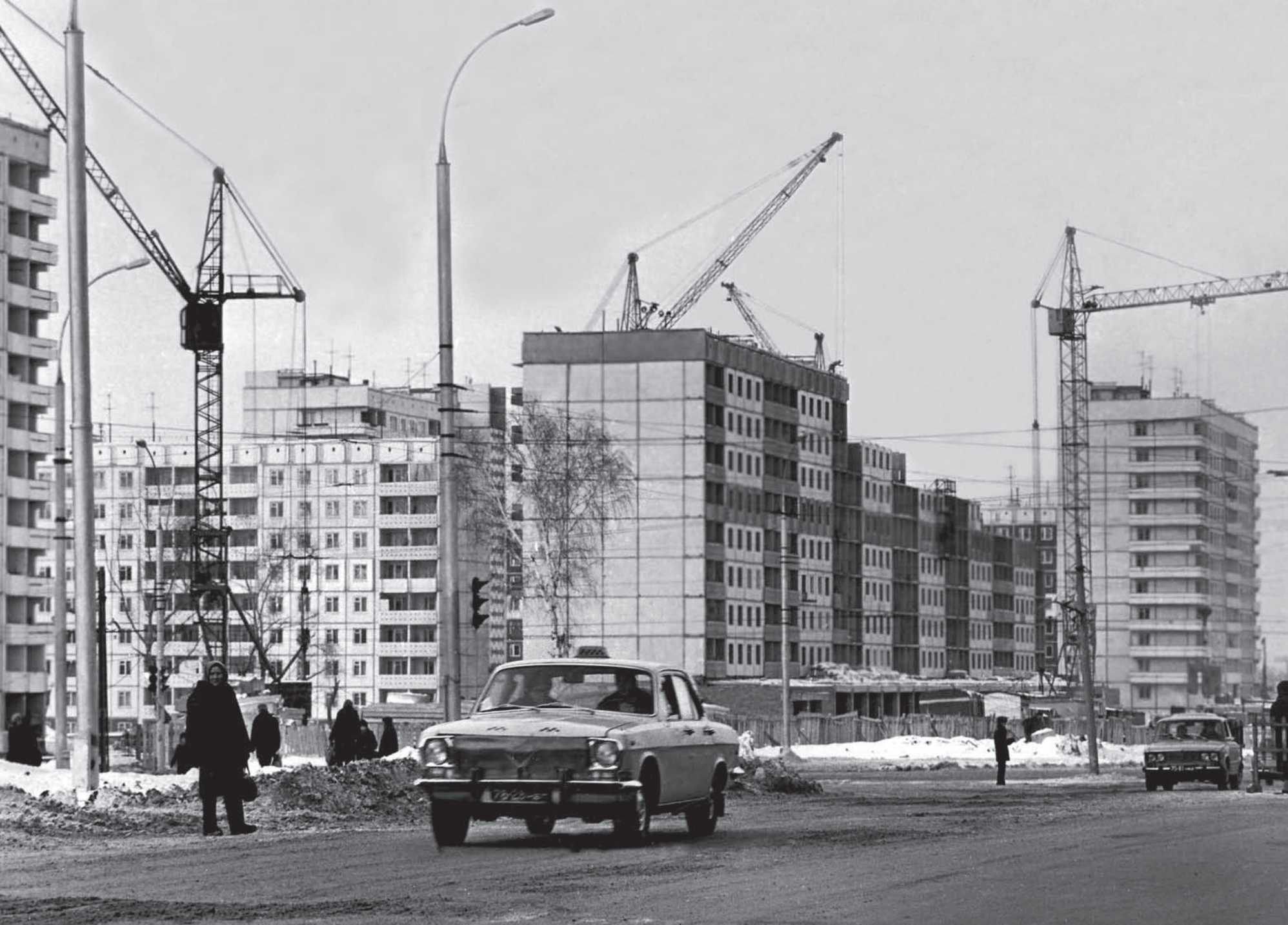
Строительство Челюскинского жилмассива Construction of Cheluskintsev residential area