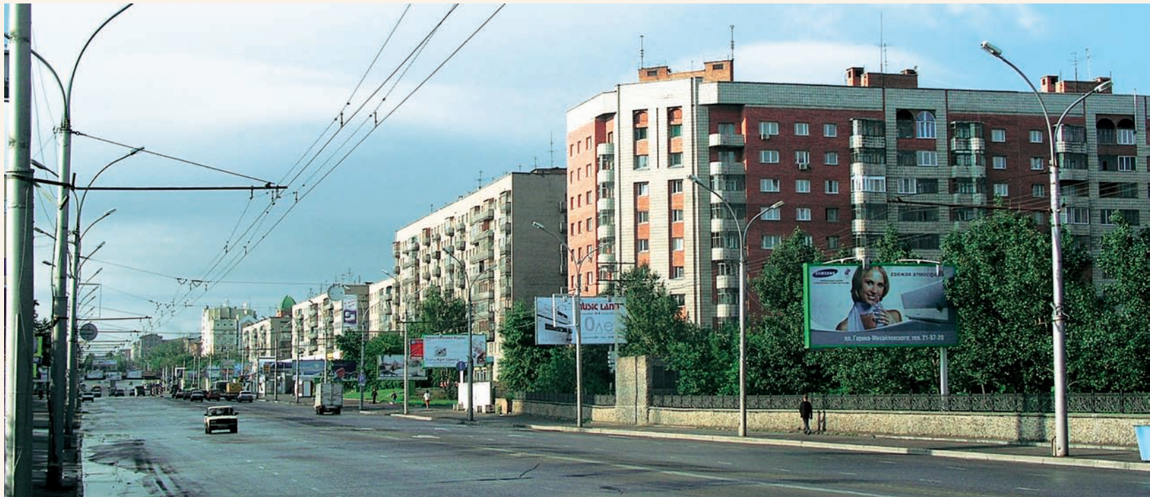
Красный проспект Krasny avenue