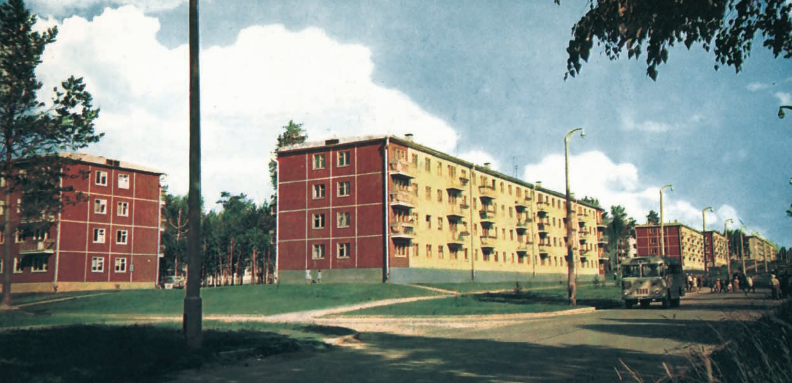
Академгородок, жилые дома Akademgorodok, residential houses