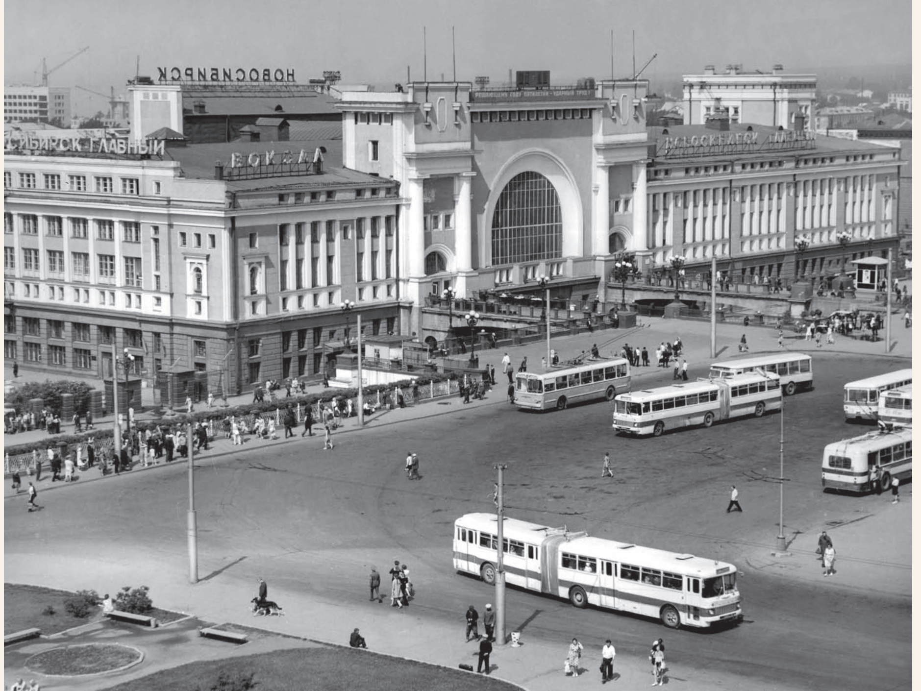
Привокзальная площадь, 70-е годы Square by the railway station, the 70s