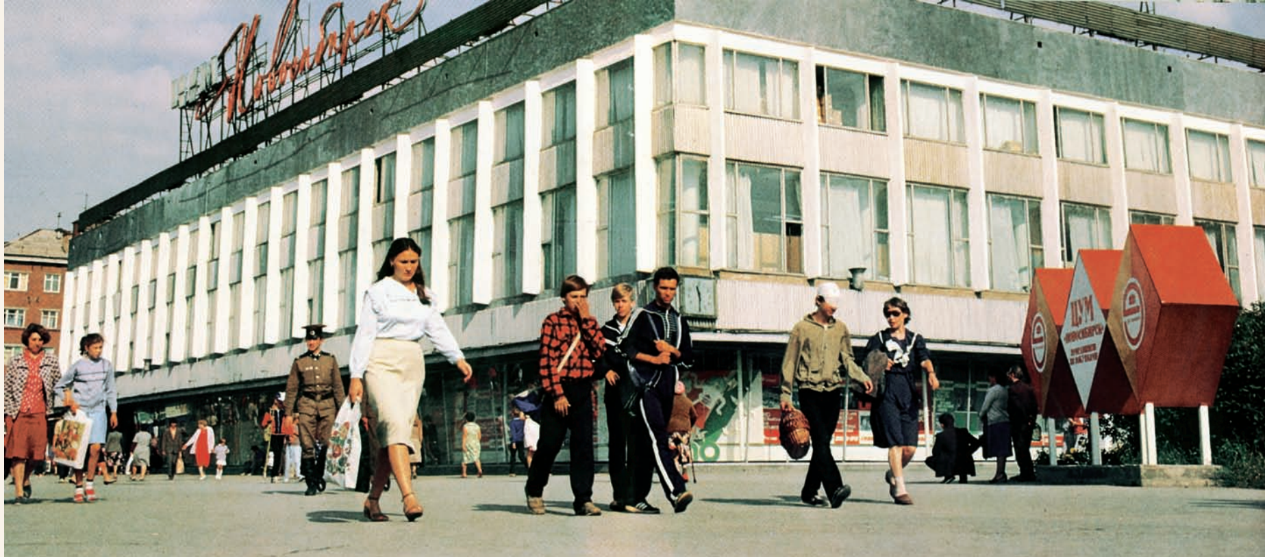
ЦУМ, 1981 год Central Department Store, 1981

ЦУМ только построили, он казался гигантским стеклянным кораблем среди вдруг почерневших бревенчатых домов, хмуро обступивших прозрачного «интервента». Чуть поодаль, с тыльной стороны ЦУМа, будто охрана, выстроились рядком три новенькие панельные пятиэтажки. А в промежутке между ними зиял огромный котлован, вырытый под строительство дома. Котлован весной залило тальми водами, и мальчишки, разгоряченные предвкушением близкого лета, устраивали путешествия по котлованному озеру на дощатых плотках. Мы отталкивались шестами от вязкого дна, курсировали от берега к берегу, но если вдруг на краю котлована появлялись чужие пацаны, мы дружно гребли к берегу и ревниво отбивали натиск любопытствующих глиняными «снежками». Там я чуть было не утонул. Спешил на выручку друзьям, завязавшим бой, нога моя скользнула меж досок в щель, а сам я вдруг оказался за бортом. Ноги на плоту, голова и грудь в воде. Хлебнул я мутной воды изрядно... На том месте теперь дом девятиэтажный, тот, что прямо за ЦУМом. Плавать я там научился».