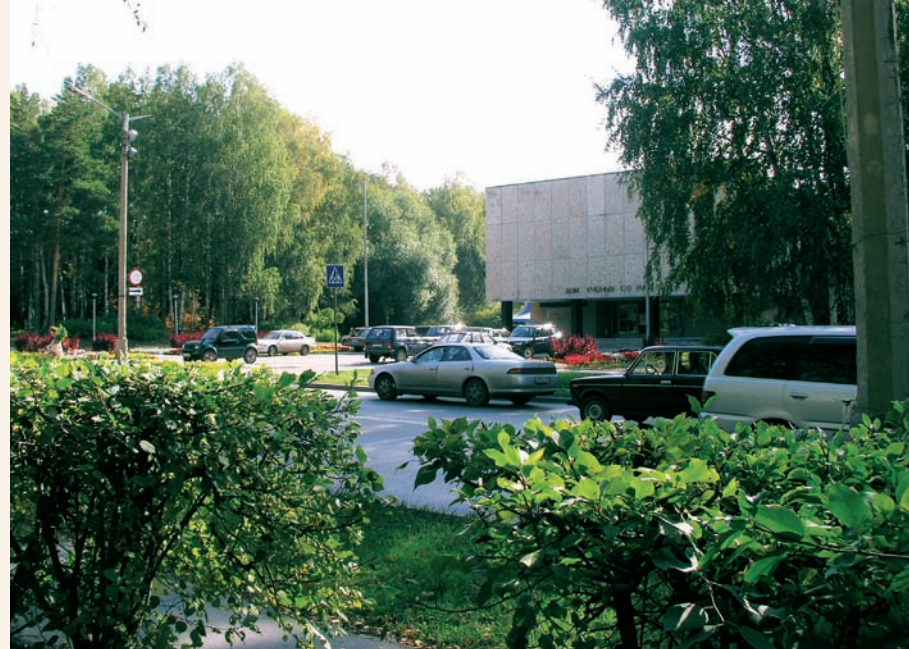
Дом ученых House of Scientists

«Совет Министров СССР одобрил предложения Лаврентьева и Христиановича. 18 мая 1957 года было принято постановление «Об организации Сибирского отделения АН СССР». Еще перед выходом постановления Лаврентьев вместе с Христиановичем отправились по Сибири, чтобы посмотреть, куда «посадить» этот центр, прибывающий извне. Сначала они побывали в Томске, где их встретили весьма неприветливо. Томичи полагали, что они находятся уже на весьма высоком научном уровне и что помощь столицы им не требуется, и если уж у государства имеются деньги, то пусть оно развивает их собственные начинания. Следующим городом стал Иркутск, где отношение к идее тоже было весьма хмурое. Там вообще недоумевали — для чего это нужно? В Новосибирск приехали, уже готовясь к нерадостной встрече. Но здесь, вопреки ожиданиям, их встретил радушный прием руководства филиала Академии наук. Новосибирские ученые полностью поддержали идею, заверили, что окажут всемерную поддержку, и даже стали торопить: чем быстрее будет создан такой научный центр, тем больше будет пользы! Это и решило вопрос о местонахождении Академгородка».