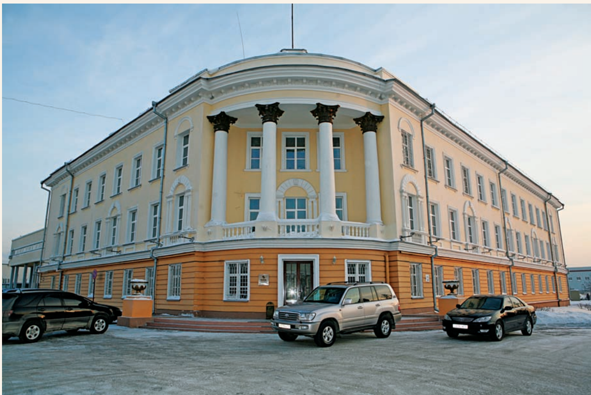
Административное здание на улице Богдана Хмельницкого Administrative center on Bogdan Khmel'nitsky street