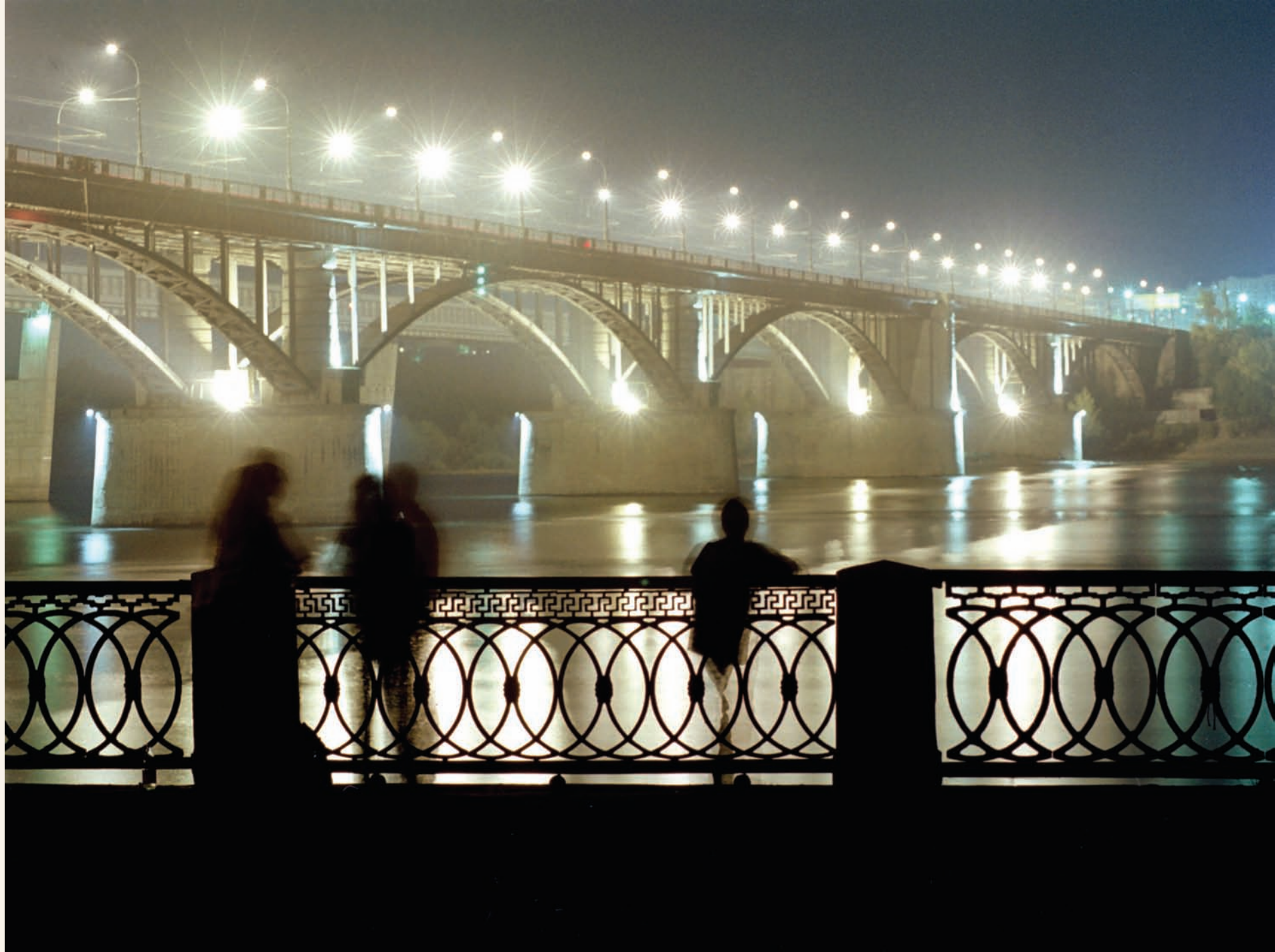
Коммунальный мост Communal bridge