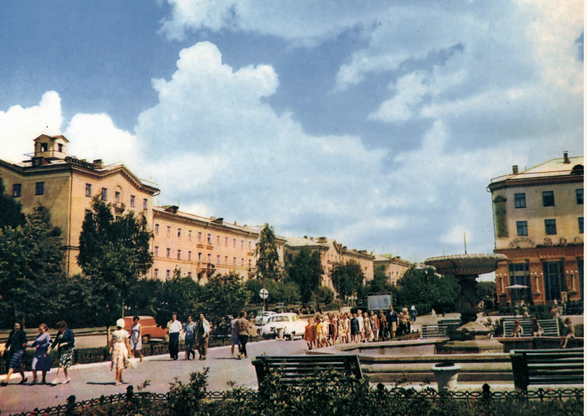
Улица Богдана Хмельницкого Bogdan Khmel'nitsky street