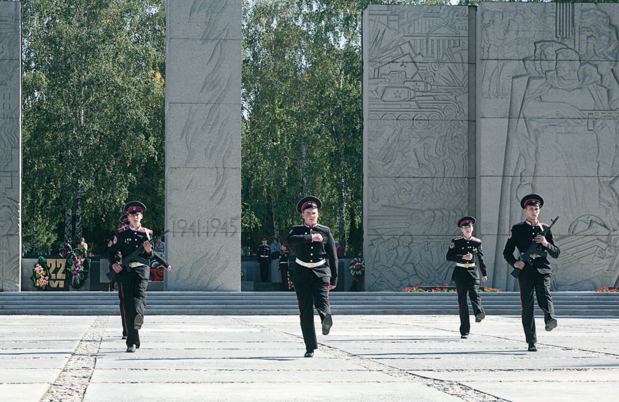
Монумент Славы Monument of Glory