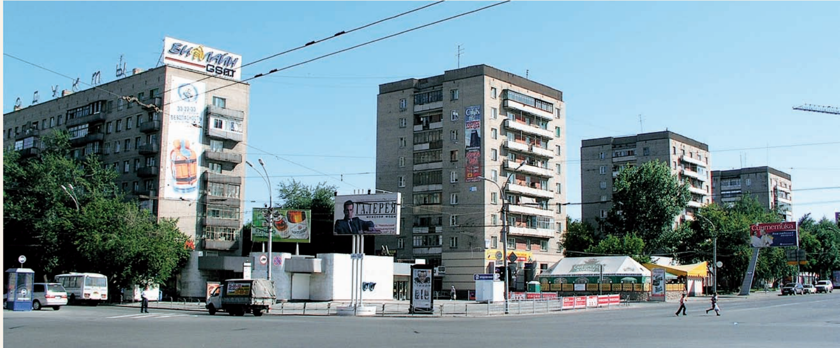
Жилые дома на улице Гоголя Residential houses on Gogol street