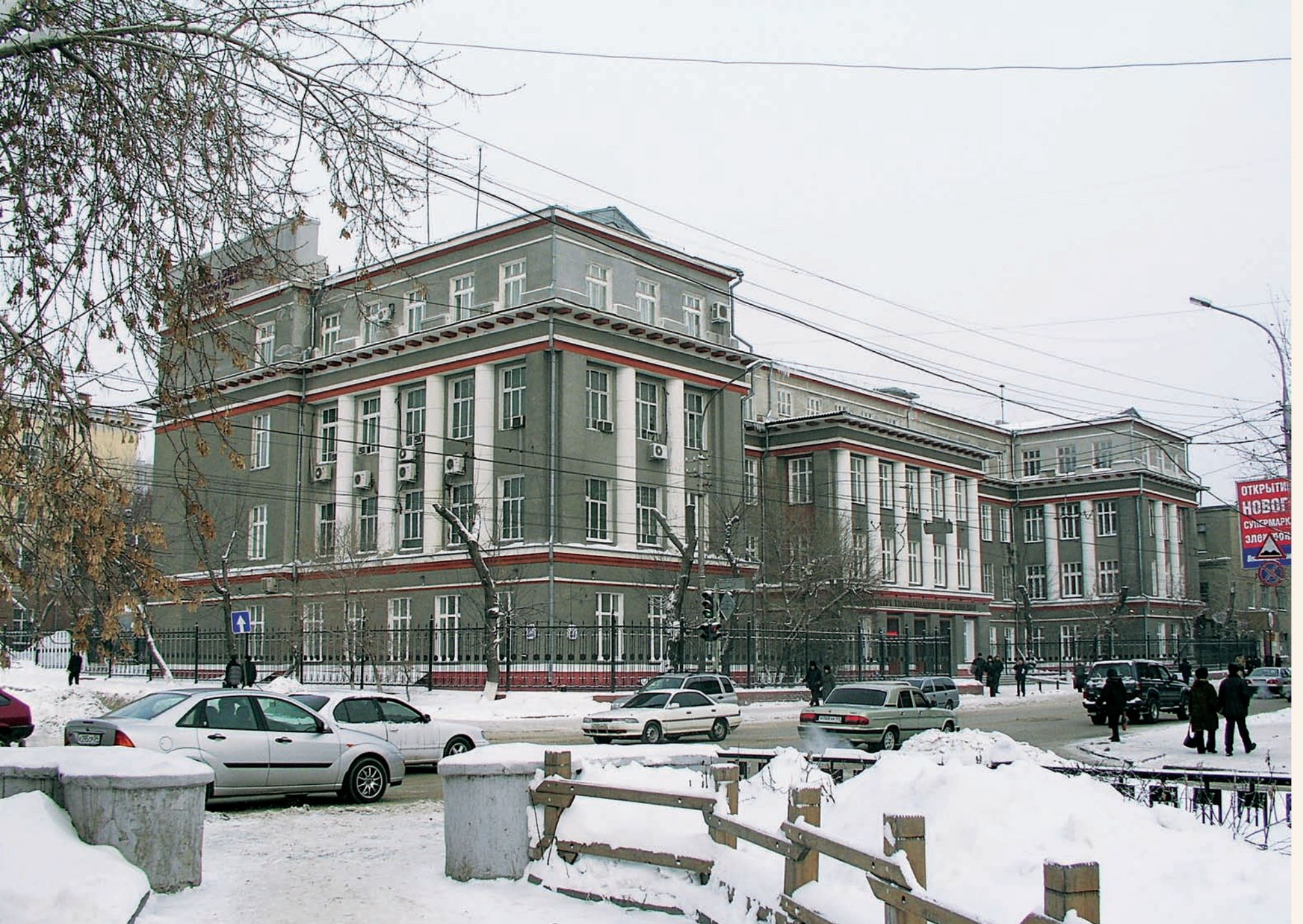
Здание института травматологии и ортопедии на улице Фрунзе Institute of traumatology and orthopedics on Frunze street