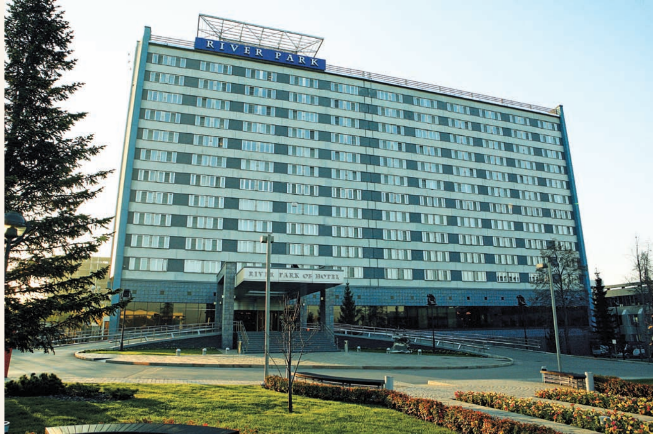
Гостиница «River park» River park hotel