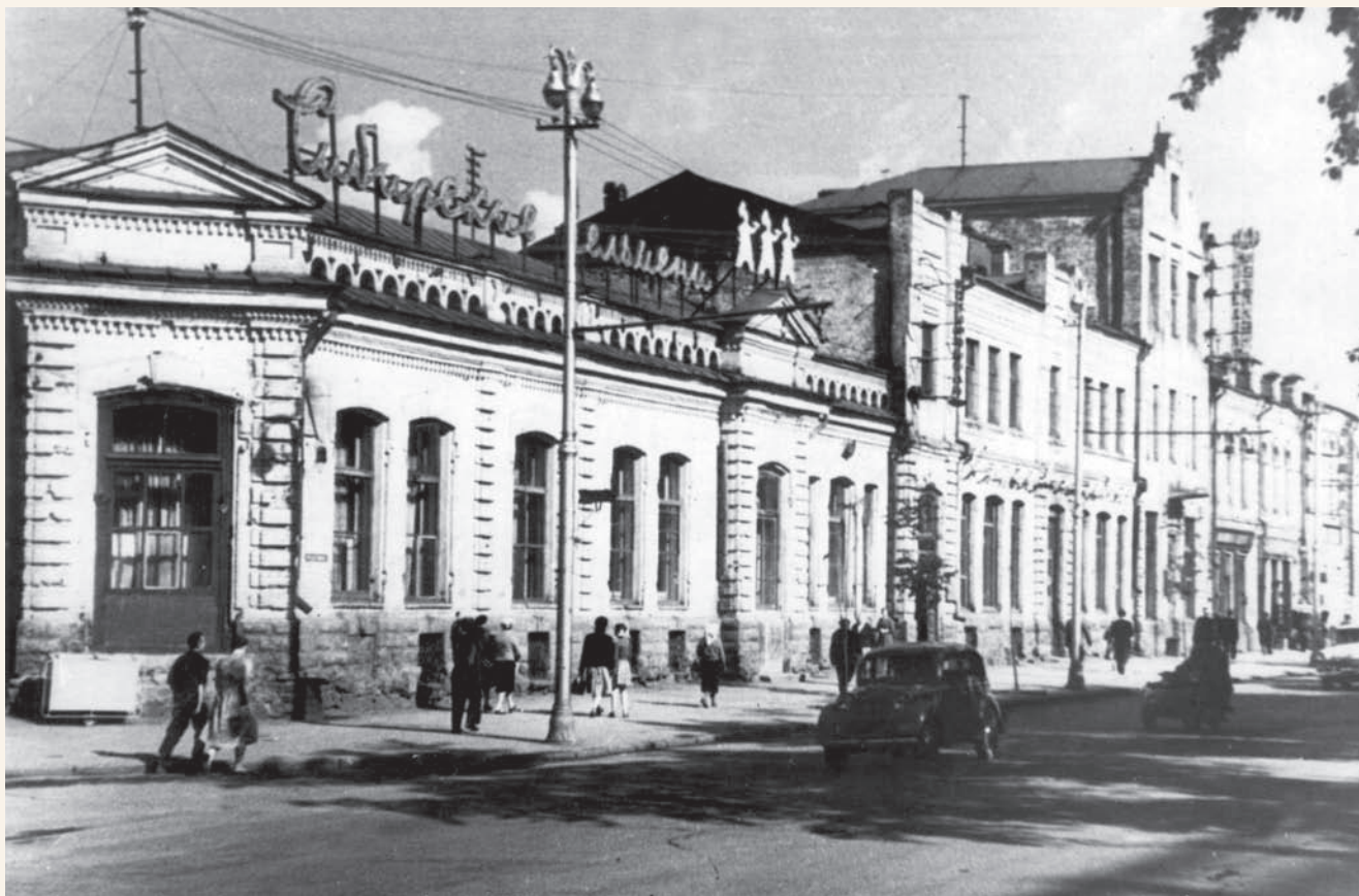
Красный проспект Krasny avenue