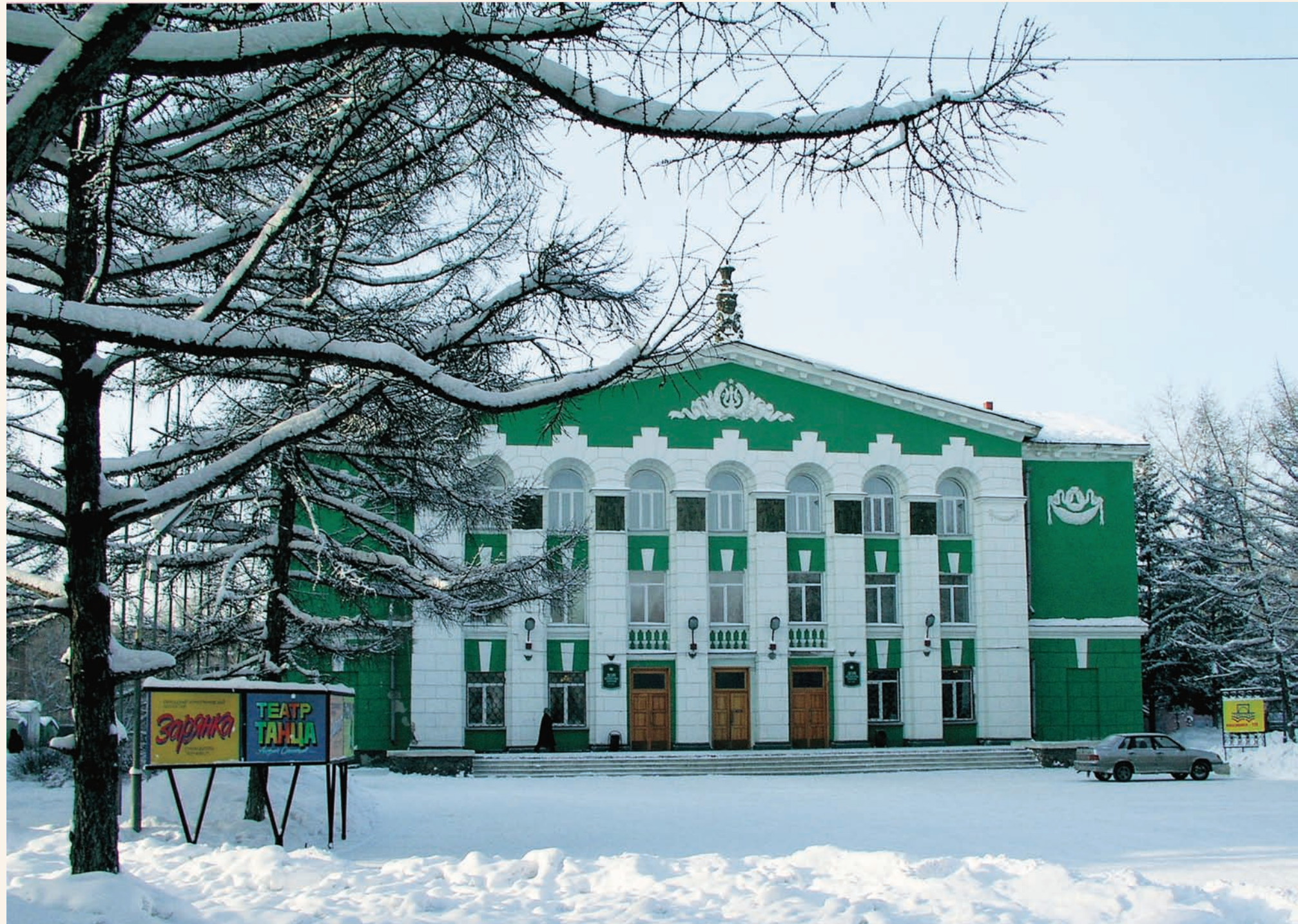
Дворец культуры им. Жданова на Красном проспекте Palace of culture in the name of Zhdanov on Krasny avenue