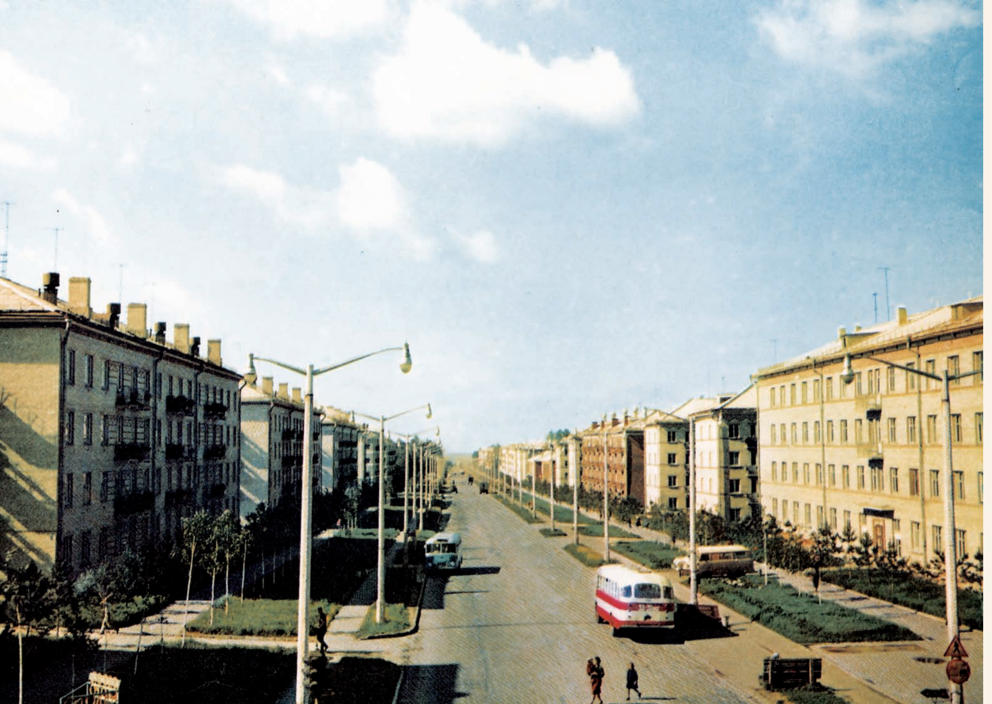
Академгородок, Морской проспект Akademgorodok, Morskoy avenue