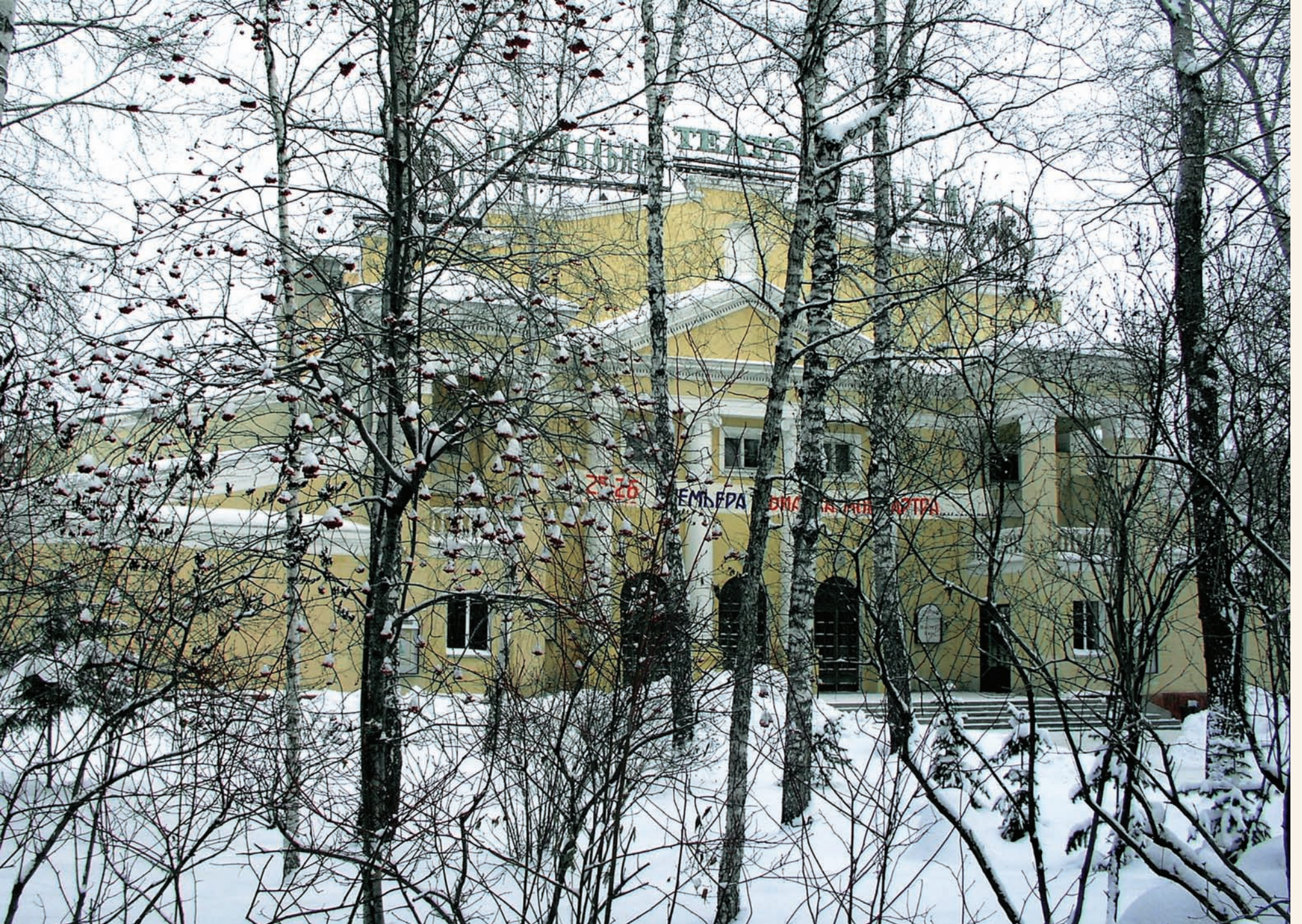
Новосибирский театр оперетты Novosibirsk operetta theater