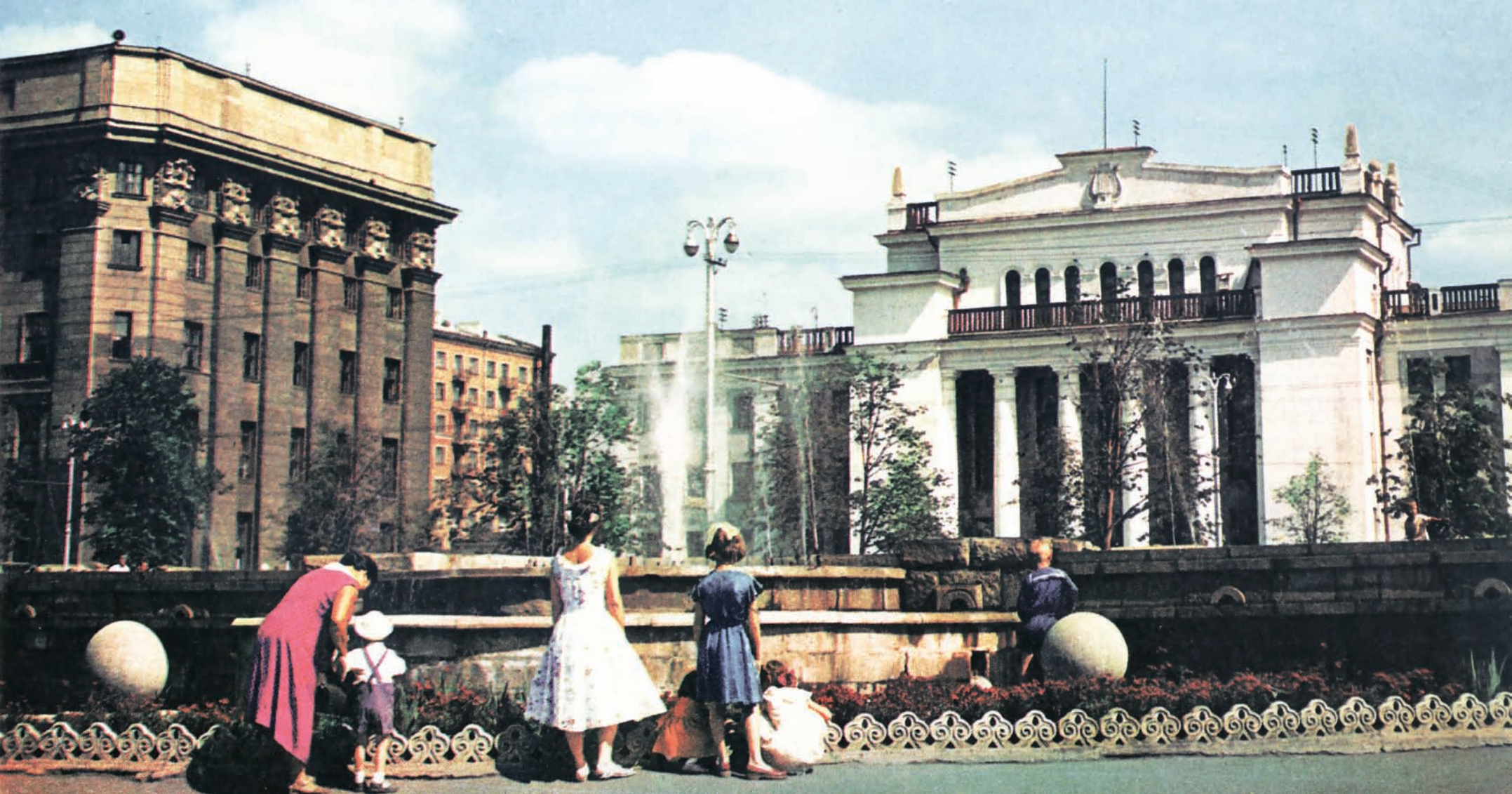
Фонтан в Первомайском сквере Fountain in Pervomaysky public garden