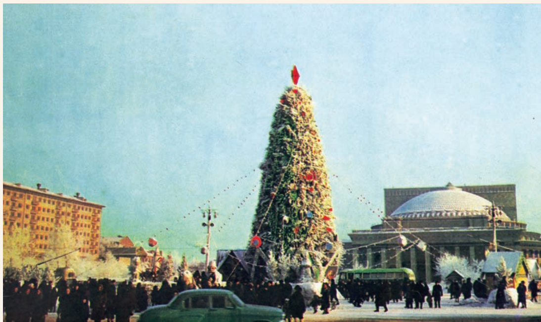
Центральная часть города Central part of the city