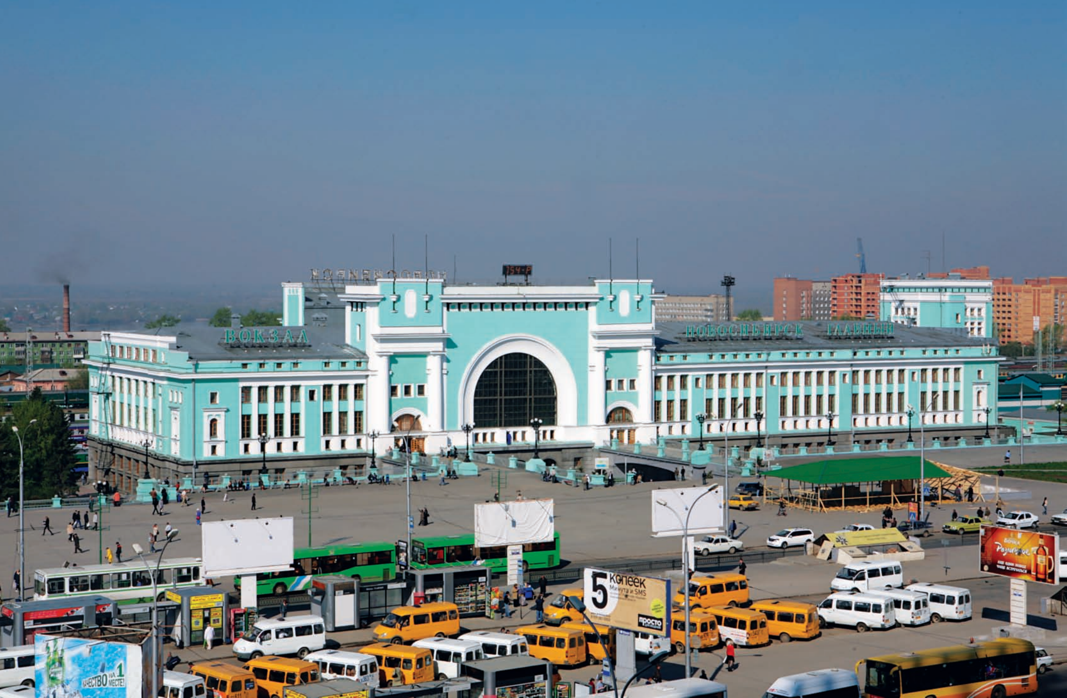
Привокзальная площадь сегодня Train station square today