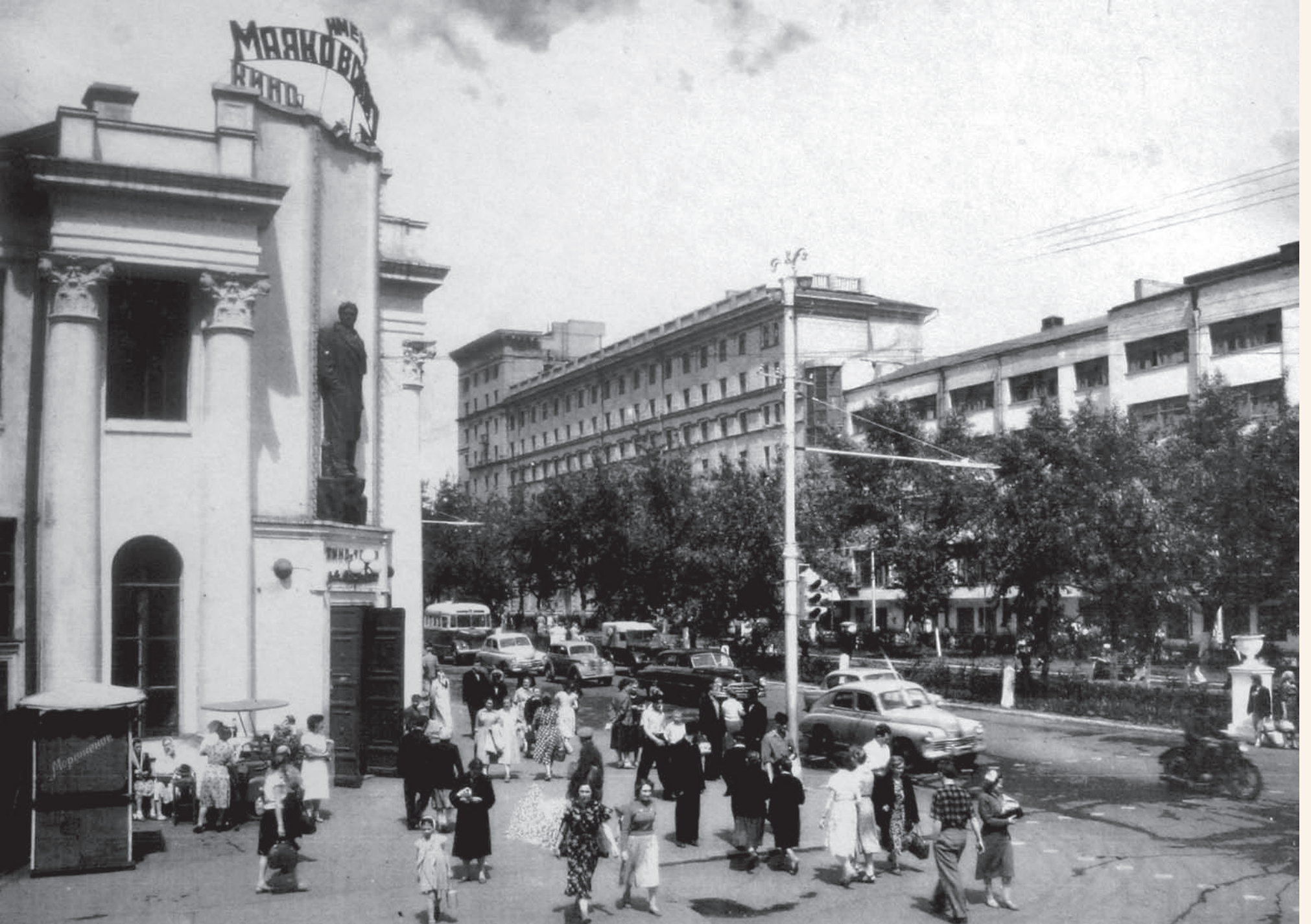
Кинотеатр имени В.В. Маяковского V.V. Mayakovsky cinema