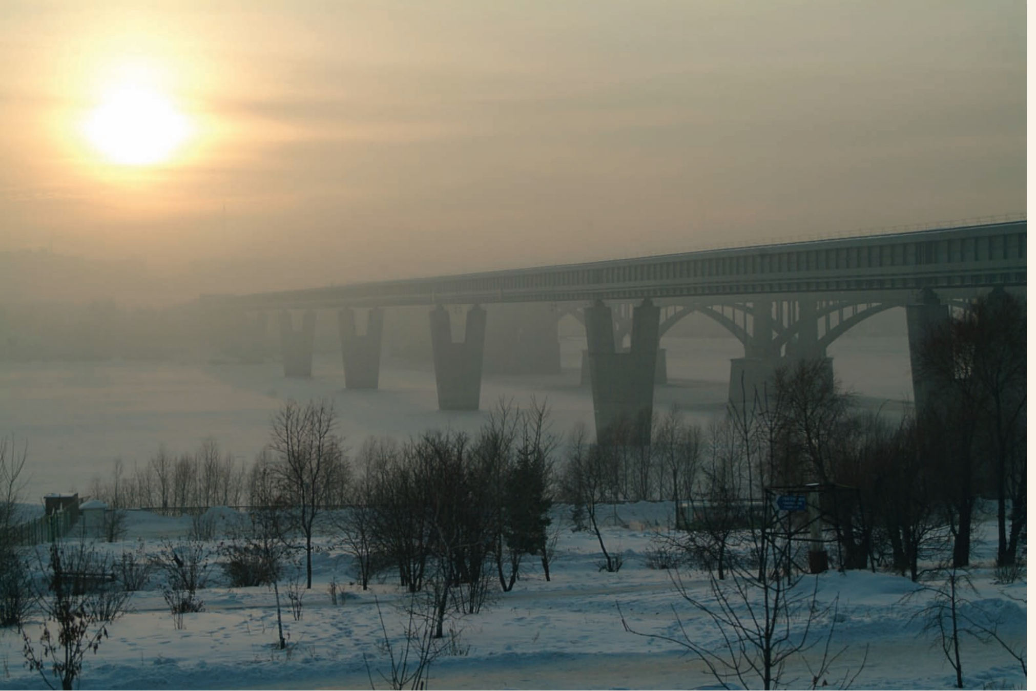
Метромост Metro bridge