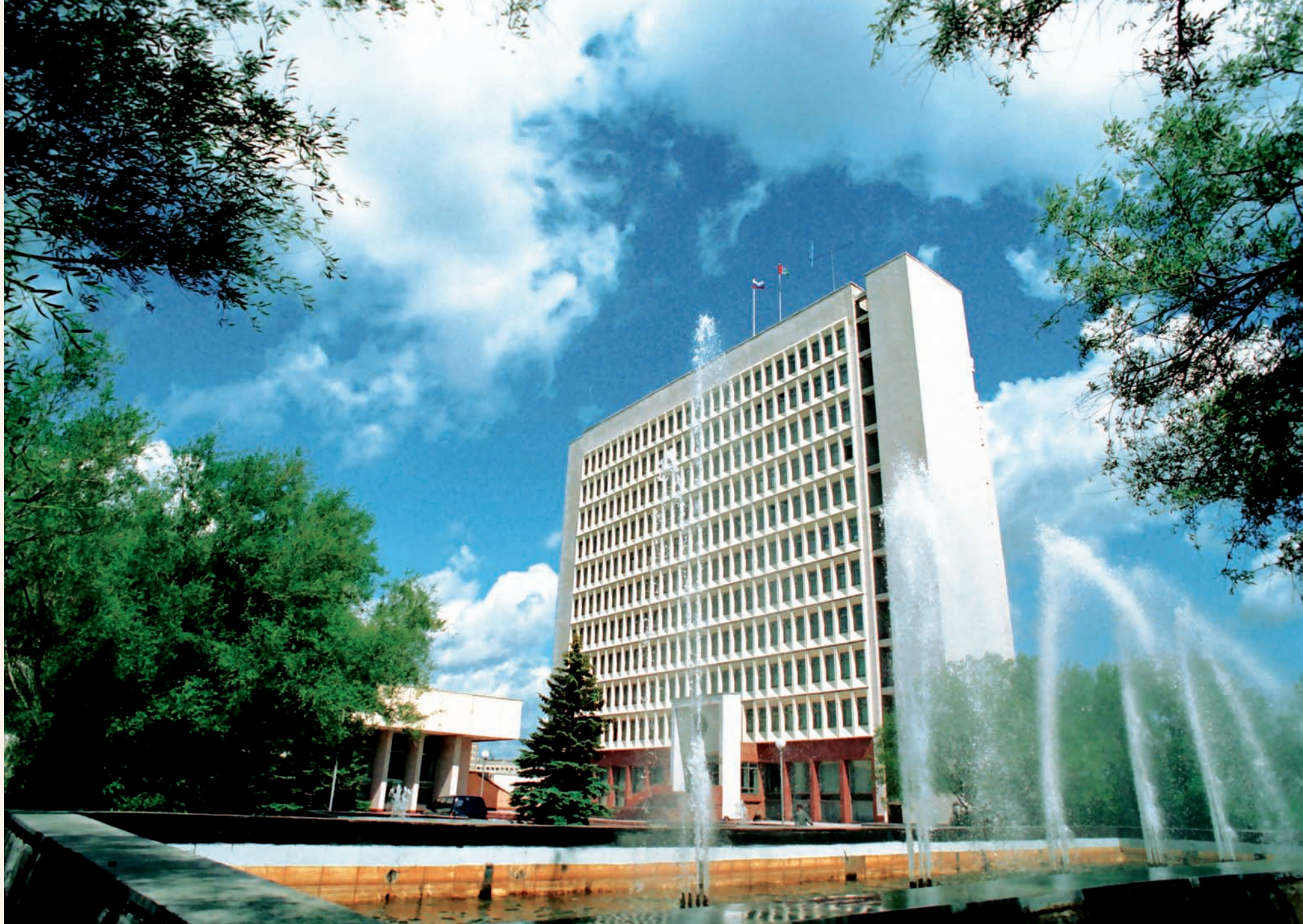
Здание Облсовета на улице Кирова Building of the Regional Council on Kirov street