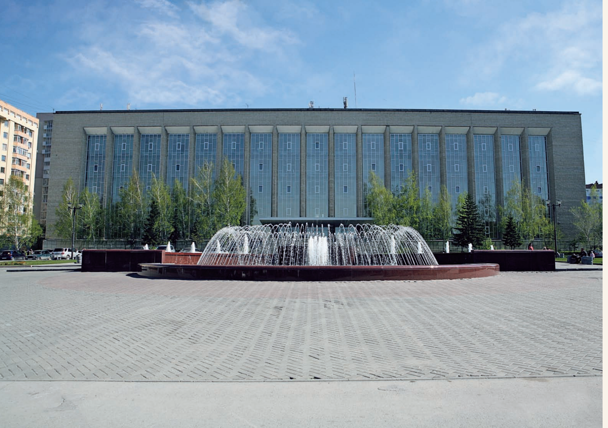
Государственная публичная научно-техническая библиотека State Public Scientific and Technical Library