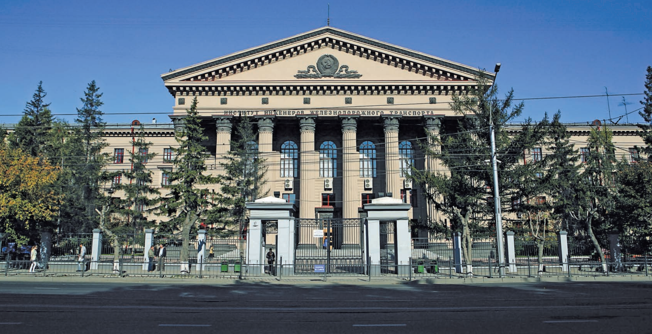
Здание Сибирского государственного университета путей сообщения (СГУПС) на улице Дуся Ковальчук Siberian State Transportation University on Dusya Kovalchuk street